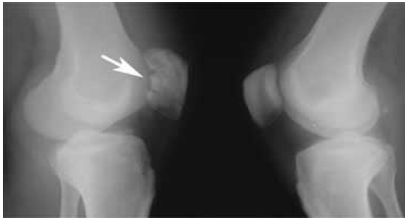
تصویر رادیوگرافی شکستگی استخوان کشکک

در تعداد بسیار کمی از افراد ممکن است استخوان کشکک به طور طبیعی دو تکه ای باشد که نباید با شکستگی اشتباه شود. در این افراد اگر از زانوی مقابل هم رادیوگرافی به عمل آید این کشکک دو تکه ای دیده می شود.